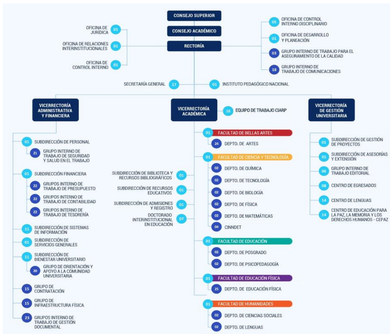
Ilustración 3. Organigrama UPN