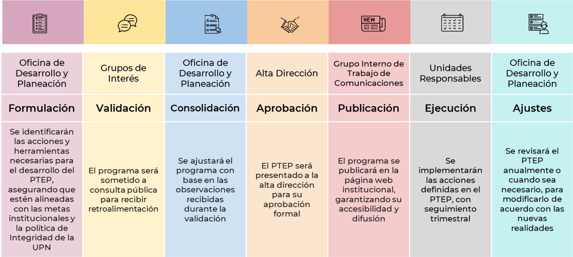
Ilustración 4. Ciclo del Programa de Transparencia y Ética Pública - Universidad Pedagógica Nacional

La implementación del Programa de Transparencia y Ética Pública (PTEP) en UPN se desarrollará a través de un ciclo estructurado que incluye las siguientes etapas: formulación, validación, consolidación, aprobación, publicación, ejecución y modificación. Cada una de estas etapas será cuidadosamente planificada para asegurar que el PTEP se integre de manera efectiva en el Plan de Acción y de Mejoramiento Institucional de cada vigencia, y responda a las necesidades y objetivos específicos de la Universidad en materia de ética y transparencia.